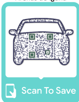
Arenas de Iguña